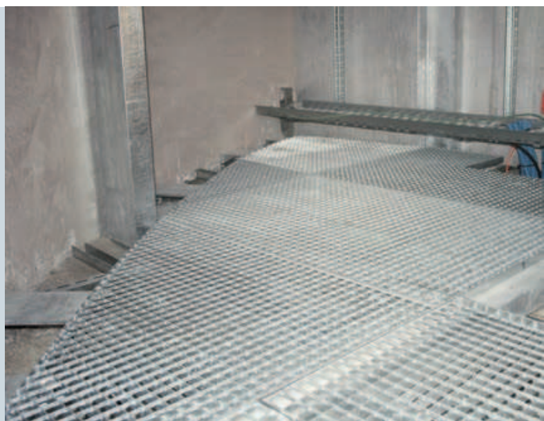
Auch im Radius verlaufende Gitterroste gehörten dazu.

die mit diversen Produkten von Sprich ausgestattet ist. In den Steigschächten wurden mehrere Sprich-Leitern verbaut, welche einen sicheren Tritt gewährleisten und den gängigen Sicherheitsnormen entsprechen. Des Weiteren wurden in den Schächten, in denen die zahlreichen Leitungen und Kabel verlaufen, Gitterrostböden verbaut, die als Absturzsicherung dienen. Dies stellte eine organisatorische Herausforderung dar, da mehrere Leute gleichzeitig am selben Ort auf