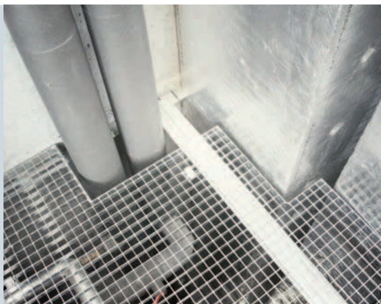
Jeder Gitterrost hat eine eigene Form.